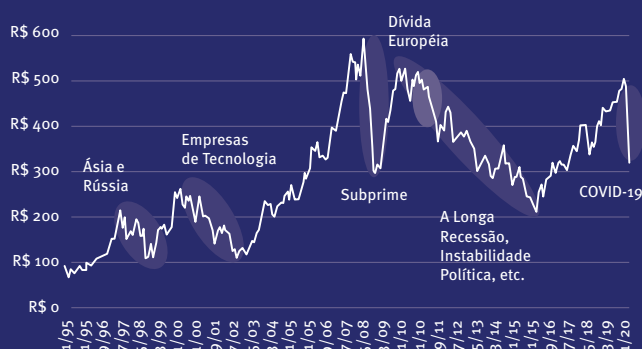
Crises e a Bolsa R$ 100 Investidos no IBOVESPA

Crises são cíclicas e superáveis, mas têm dimensões e impactos diferentes, além de custo humano e financeiro.